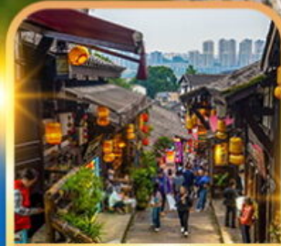
หมู่บ้านโบราณฉือชี่โจว