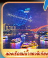
ล่องเรือแม่น้ำแยงซีเกียง