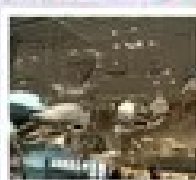
พิพิธภัณฑ์วิทยาศาสตร์