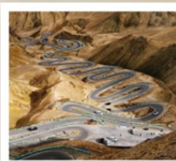
ถนนโบราณผานหลง