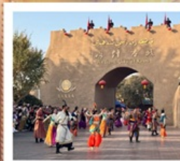
เมืองโบราณคัชการ์