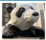
ห้าง IFS แพนด้าป็นตึก