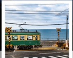
รถไฟเอโนะเดิน