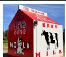
ฟาร์มโคนมจินเหมิน