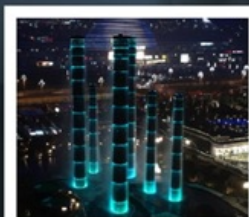
ห้างสรรพสินค้า SKP