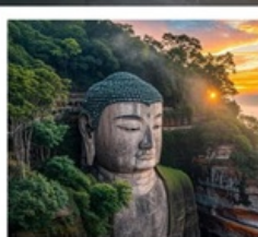
หลวงพ่อโตเล่อซาน