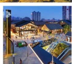
ถนนคนเดินไท่กู่หฺลี่