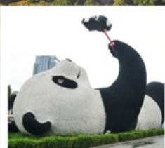
รูปปั้นแพนด้าเซลฟี่