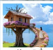
หมู่บ้านเหวินปี้

เมืองโบราณต้าหลี่ / นั่งเรือสู่เกาะเสี้ยวผู่ / ซานโตรินี (รวมรถแบตเตอรี่) / ถนนทางเออร์ต้าต้า / ภูเขาอินเซียงซาน / ต้าซ่าท่าเรือหลงกัน โค้ง S ทะเลสาบเอ้อไห้ / หมู่บ้านโบราณสี่จิว / หมู่บ้านเหวินปี้ / ชมดอกไม้ตามฤดูกาล