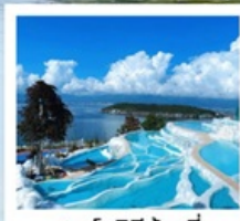
ซานโตรินีต้าหลี่

“เกาะเสี้ยวผู่...เกาะลึกลับกลางทะเลสาบ เอ้อไห้”