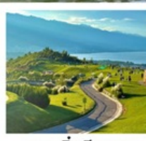
ภูเขาอินเซียงซาน