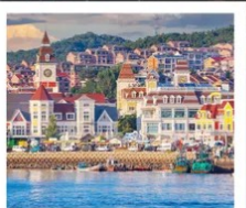
ท่าเรือประมงเหยียนโกะ