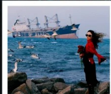
เรือควิวส

หอคอยกาลเวลา / รูปปั้นปลาวาฬ / ถนนโบราณเตาหยาง / ย่านสงโขว่ 1920 / เมืองเว่ยไห่ / ถนนฮั่วจวีป่า / จตุรัสประตูแห่งความสุข ย่านอันลอฟาง / เรือควิวส / หาดซาจื่อโหว่ / ถนนหลงเจียง / สะพานจันเจียว / หาดไซเบอร์ No. 3 ถนนจงซาน / โบสถ์ St.Emill / จตุรัส 54 / ศูนย์เรือใบโอลิมปิก / พิพิธภัณฑ์มิแยร์ชิงเต่า / ถนนโตตง / ท่าเรือประมงเหยียนโกะ