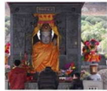
ไถ่ฮ่องกง