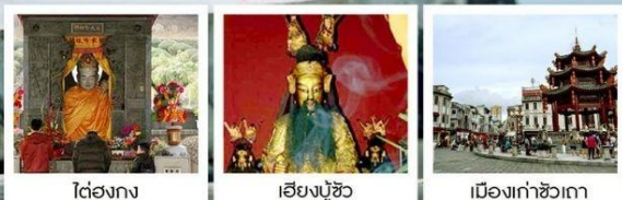
ใต้สองกง