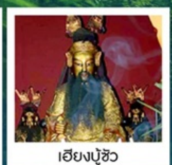
เฮียงบู๊ซิว