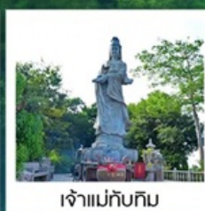
เจ้าแม่ทับทิม