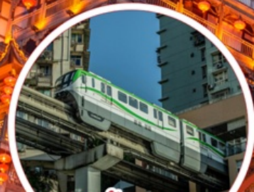
รถไฟฟ้า-ลูตีก Liziba Station