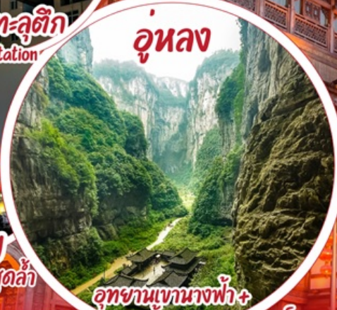
อุทยานเขานางฟ้า + อุทยานหลุมฟ้า 3 สะพานสวรรค์