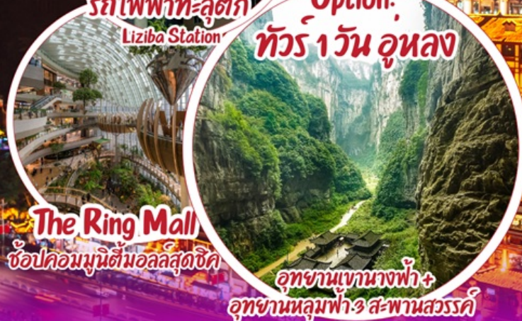
The Ring Mall