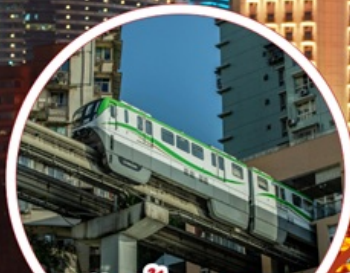
รถไฟฟ้า-ลูตึก Liziba Station