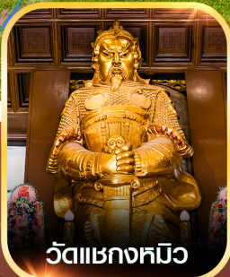
วัดแซงกหมีว

✈️ คอนเฟิร์มออกเดินทาง ทุกพีเรียด 2 ท่านขึ้นไป