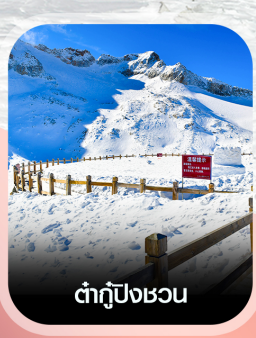
ต้ากู่ปิงชอน

คอนเฟิร์มออกเดินทาง ทุกพีเรียด 2 ท่านขึ้นไป