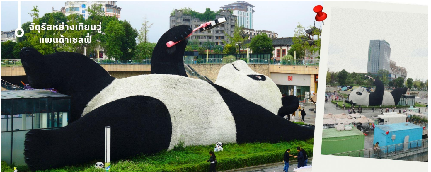
จัตุรัสหย่างเทียนวู แพนด้าเซลฟี่

หลังรับประทานอาหารเช้า นำท่านเที่ยวชม จัตุรัสหย่างเทียนวู เป็นจุดเช็คอินที่สำคัญสำหรับคนที่มาเที่ยวที่ เมืองตูเจียงเยียน บริเวณจุดดำขา อำเภอตูเจียงเยียน นครเฉิงตู ไฮไลท์ของจัตุรัสหย่างเทียนวู คือ ประติมากรรม แพนด้ายักษ์ที่กำลังนอนหงายท้อง ยื่นมือถือไม้เซลฟี่สีชมพู ซึ่งออกแบบโดยนักออกแบบชื่อดัง Florentijn Hofman รูปปั้นแพนด้ายักษ์มีความยาว 26 เมตร กว้าง 11 เมตร สูง 12 เมตร และหนัก 130 ตัน แบบท่าทางสบายๆของแพนด้าที่ความประทับใจและรอยยิ้มให้กับผู้ที่มาเยือนจัตุรัสหย่างเทียนวู สามารถดึงดูดนักท่องเที่ยวได้เป็นจำนวนมากเลยทีเดียว เป็นการแสดงออกด้วยภาษาทางศิลปะแบบหนึ่งที่สะท้อนชีวิตในท้องถิ่น มอบความรู้สึกสนิทสนมและมีความสุขกับผู้ชม อิสระเดินชมถ่ายภาพ รูปปั้นแพนด้าเซลฟี่ ตามอัธยาศัย ที่นี่เป็นจุดเช็คอินที่เหมาะสมสำหรับทุกเพศทุกวัย หากคุณกำลังมองหาสถานที่ท่องเที่ยวใหม่ๆ ที่เต็มไปด้วย ความทรงจำดีๆ จัตุรัสหย่างเทียนวู คือคำตอบที่สมบูรณ์แบบ