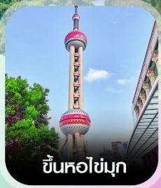
ขึ้นหอไข่มุก