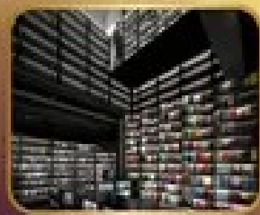
ชมร้านหนังสือ