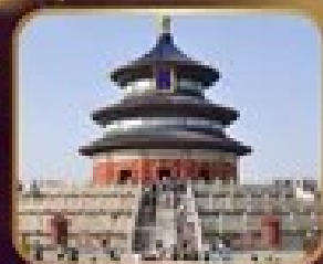
ชมความงดงาม