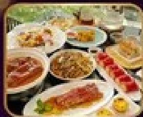
อาหารจีน 10 มื้อ