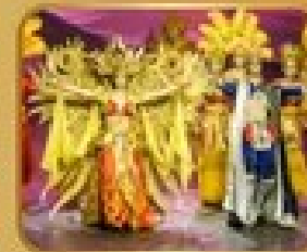
ชมการแสดงโขนจีน