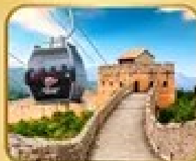
ถ่ายภาพเมืองจีน