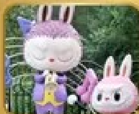
เที่ยวสวนสนุก