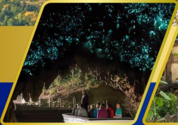
ถ้ำนอนเรื่องแสง