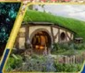
หมู่บ้านฮอบบิต