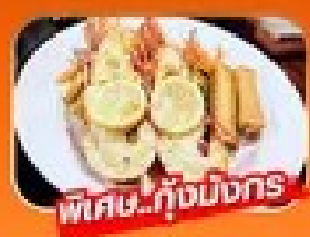
พิเศษ! กุ้งมังกร