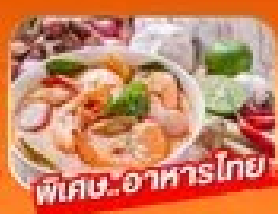
พิเศษ! อาหารไทย

1 - 5 เม.ย. / 29 เม.ย. - 3 พ.ค. 69 27 - 31 พ.ค. 69