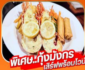
พิเศษ..กุ้งมังกร เสิร์ฟพร้อมไวน์

1 - 5 เม.ย. / 29 เม.ย. - 3 พ.ค. 69 27 - 31 พ.ค. 69