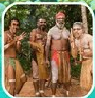
Rainforestation Aboriginal Show