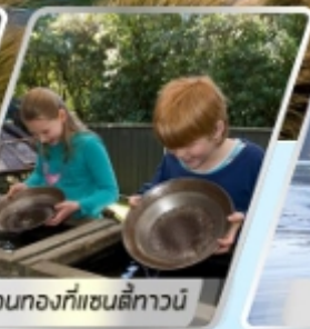
ล่องทงกที่แซนตีทาวน์