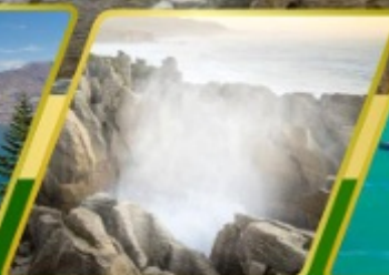
ไพล์, แพนเค็กหรือค