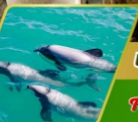
ล่องเรือชมโลมา