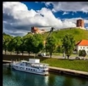
วิลเนียส