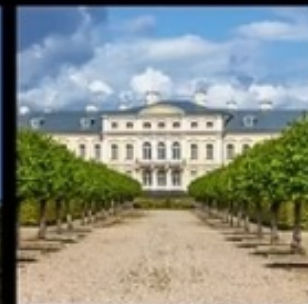
พระราชวังวิลเนียส