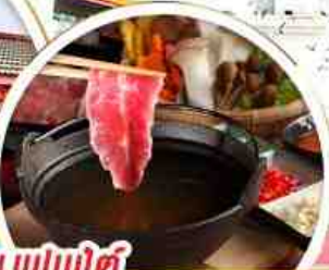
บุฟเฟ่ต์ ซาฮูทมิ้อไฟโตทวัน