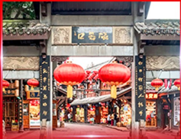
หมู่บ้านโบราณฉิวซีโหว่