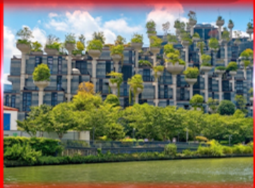
ตึก 1,000 ต้นไม้