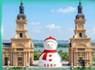
ตุ๊กตาหิมะยักษ์ ฮาร์บิน