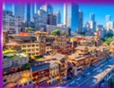
เซ็คอินย่านตึง หงหยาดึง