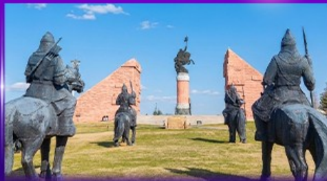
สวนสาธารณะเจงกิสข่าน