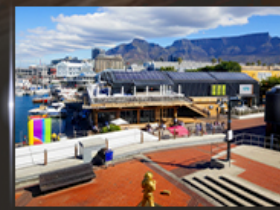
ท่าเรือ V&A waterfront