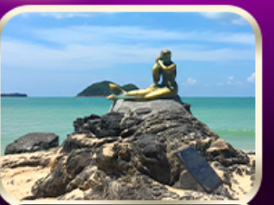
เที่ยวหาดสมิหลา สงขลา