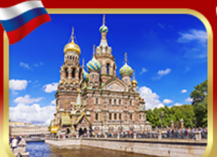
เซ็คอินโบสกแห่งหอยดิลีอด