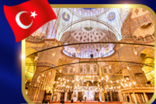
ชมความงามสุหร่าสีน้ำเงิน