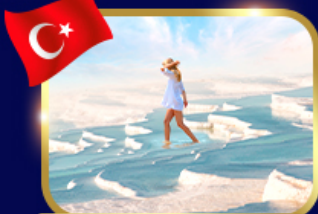
ปราสาทปูยฝ้าย ปามุคคาเล่