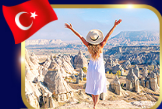
หุบเขาแห่งรัก คัปปาโตเกีย