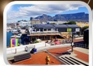
ช้อปปิ้งท่าเรือแบรนด์ชั้นนำ V&A waterfront