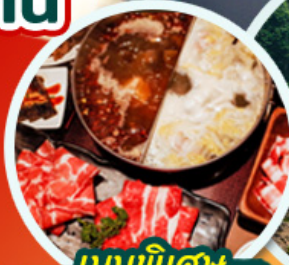
เมนูพิเศษ ชาบูหม่าล่า