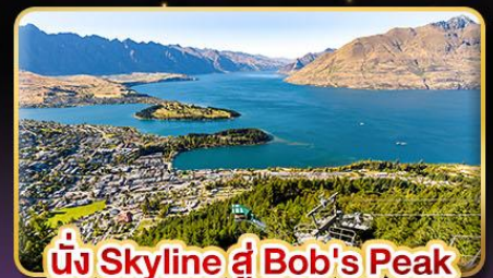
นั่ง Skyline สู่ Bob's Peak