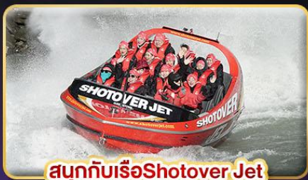
สนุกกับเรือ Shotover Jet