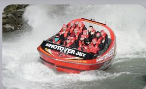
สนุกกับเรือ Shotover Jet