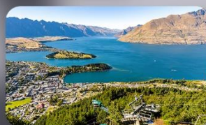
นั่ง Skyline สู่ Bob's Peak