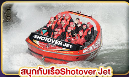
สนุกกับเรือShotover Jet