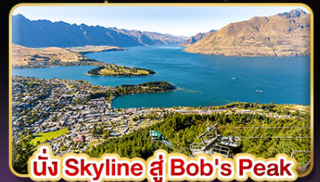
นั่ง Skyline สู่ Bob's Peak