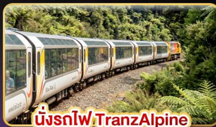
นั่งรถไฟ TranzAlpine