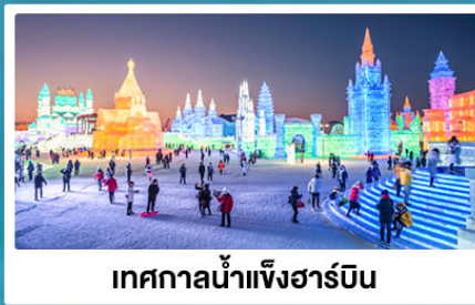
เทศกาลน้ำแข็งฮาร์บิน