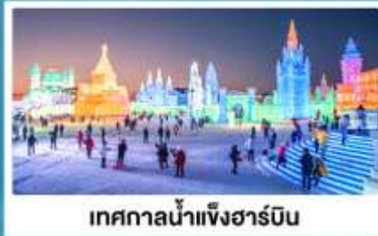
เทศกาลน้ำแข็งฮาร์บิน