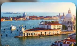
ชมความงามเมืองเวนิส