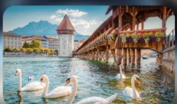
สะพานไม้ซาเปล