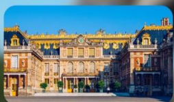
เข้าชมพระราชวังแวร์ซาย