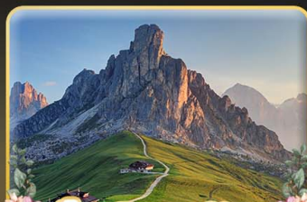
เยือน Passo Giau