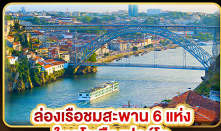
ล่องเรือสะพาน 6 แห่ง ในคูโรเมืองปอร์โต