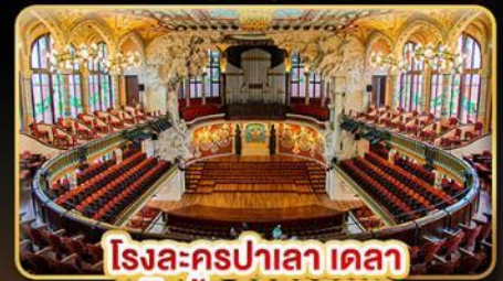
โรงละครปาเลา เดลา มูสิกา คาทาลานา