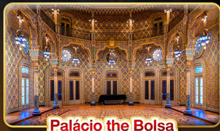
Palácio the Bolsa

📅 เดินทาง : 01-10 พ.ค. | 29-07 มิ.ย. | 09-18 ต.ค. 69