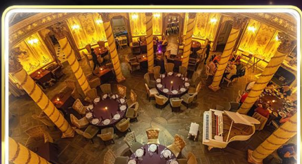
ทานอาหารสุดหรู ภัตตาคาร Turandot