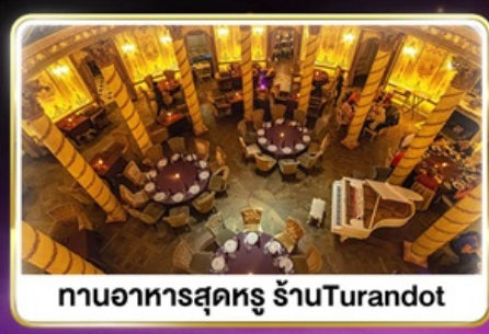
ทานอาหารสุดหรู ภัตตาคาร Turandot