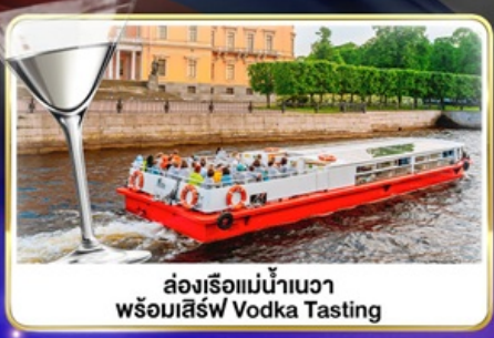
ล่องเรือแม่น้ำเนวา พร้อมเสิร์ฟ Vodka Tasting