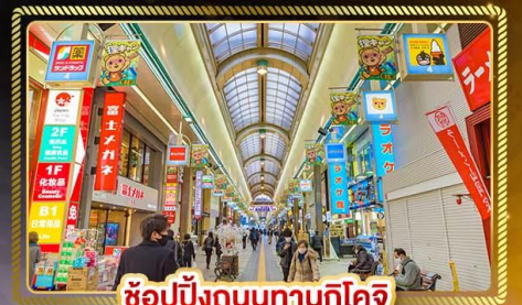
ช้อปปิ้งถนนทานุกิโคจิ