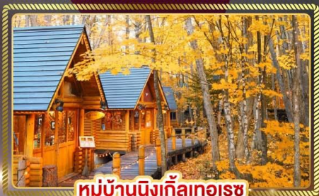
หมู่บ้านนิงเกิ้ลทอเรซ