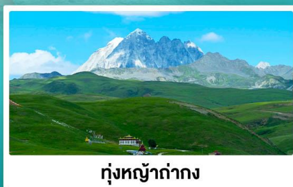
ทุ่งหญ้าท่ามกลาง