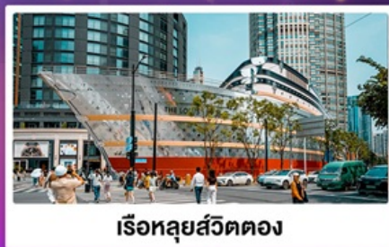
เรือทูลุยส์วัดตอง