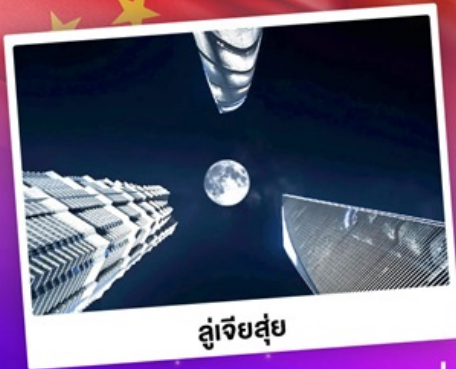
ดูเจียสู่ย

ใช้แผนเดินทาง "เซี่ยงไฮ้" เที่ยวดิสनीแลนด์ดูพลุสุดอลัง