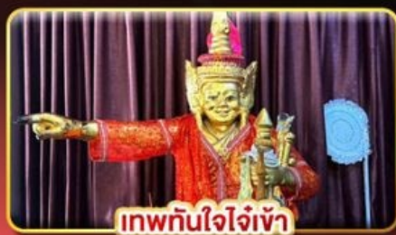
เทพทันใจใจเจ้า