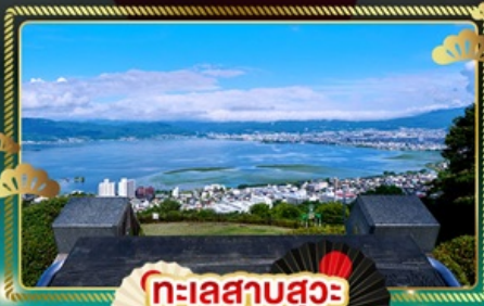
ทะเลสาบสุวะ

เส้นทางธรรมชาติ จุดชมวิวยามเย็นแอลป์ เที่ยวครบ ใช้รถทุกวัน ไม่มีวันเอิร์ธ