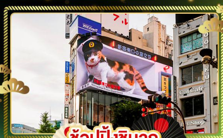
ช้อปปิ้งซินจูกุ