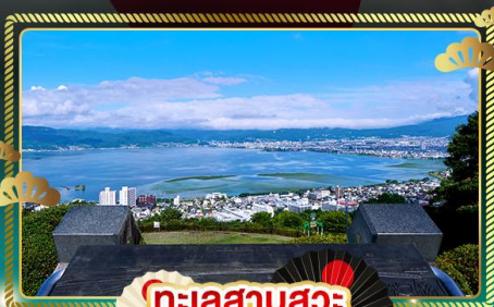
ทะเลสาบสุวะ

เส้นทางธรรมชาติ จุดชมวิวกาเบเนออลปี เที่ยวครบ ใช้รถทุกวัน ไม่มีวันอิสระ