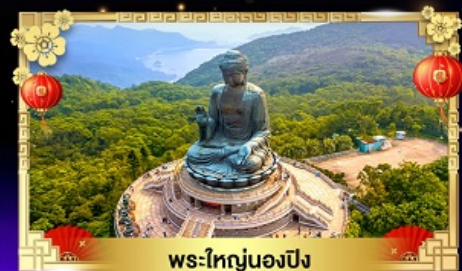
พระใหญ่องปิง