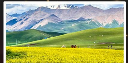
ทุ่งหญ้าจีเหลียน