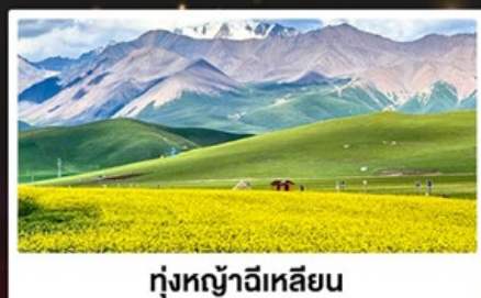
ทุ่งหญ้าฉีเหลียน